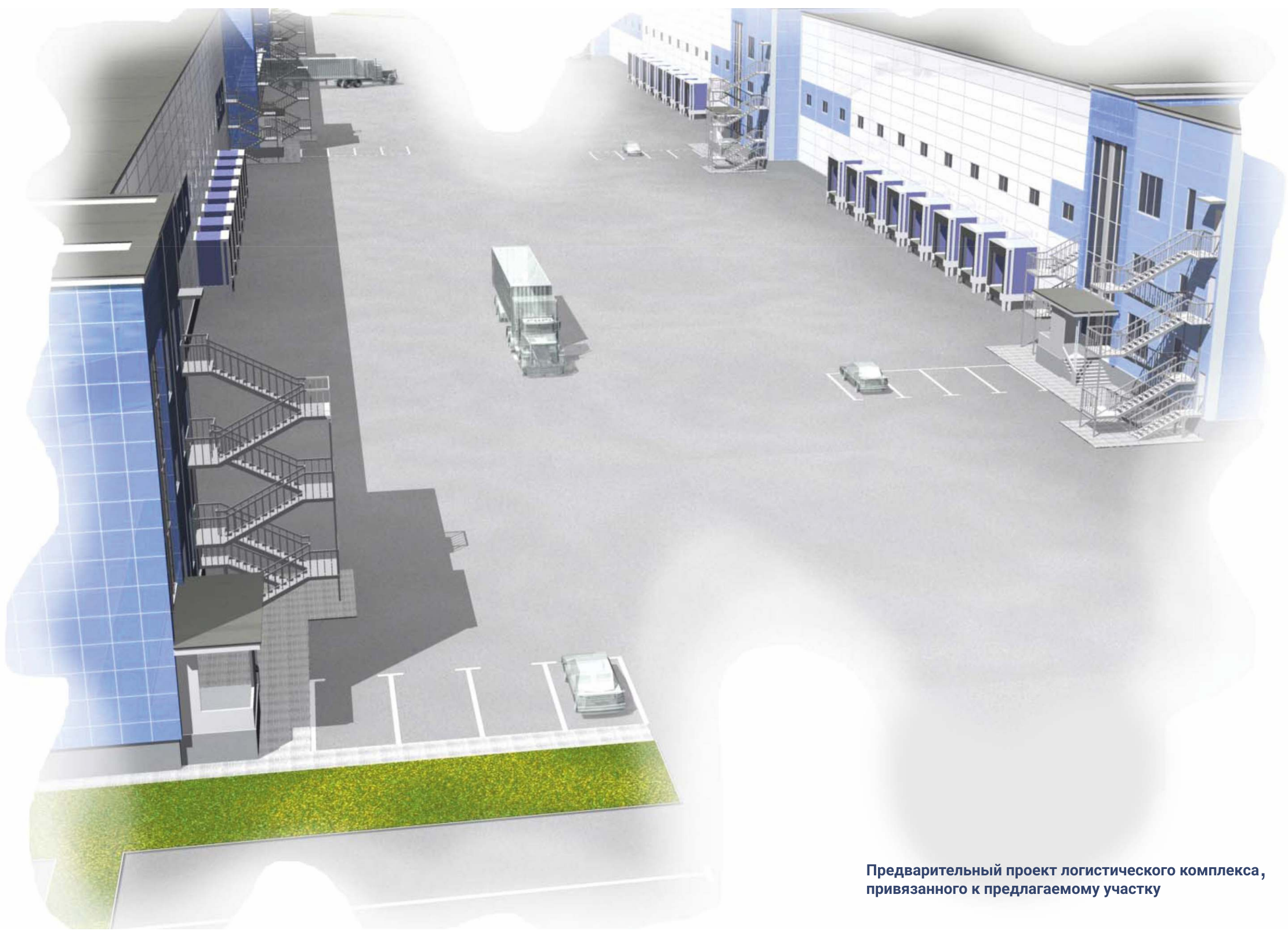
Предварительный проект логистического комплекса, привязанного к предлагаемому участку